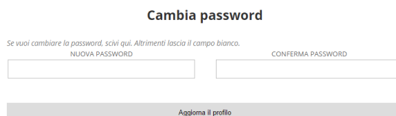
Figura 2 - Cambio Password

Viene visualizzato il profilo Cliente in cui definire la password personale da utilizzare nei successivi accessi: