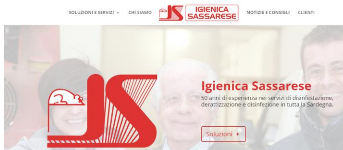
Figura 1 - Accesso Clienti

Nella successiva pagina web viene richiesto di cliccare su Devi effettuare l'accesso